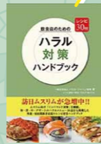
「飲食店のためのハラール対策ハンドブック」