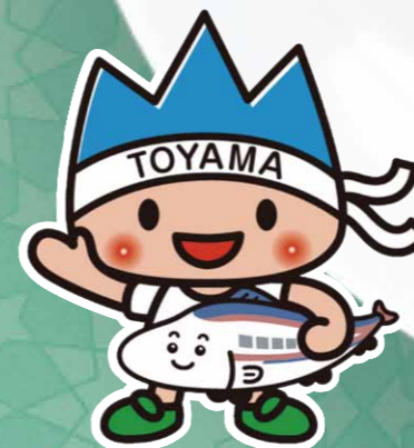
元気どやま Mascot きときと君