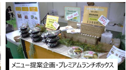
メニュー提案企画・プレミアムランチボックス