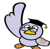
埼玉県のマスコット 「コバトン」