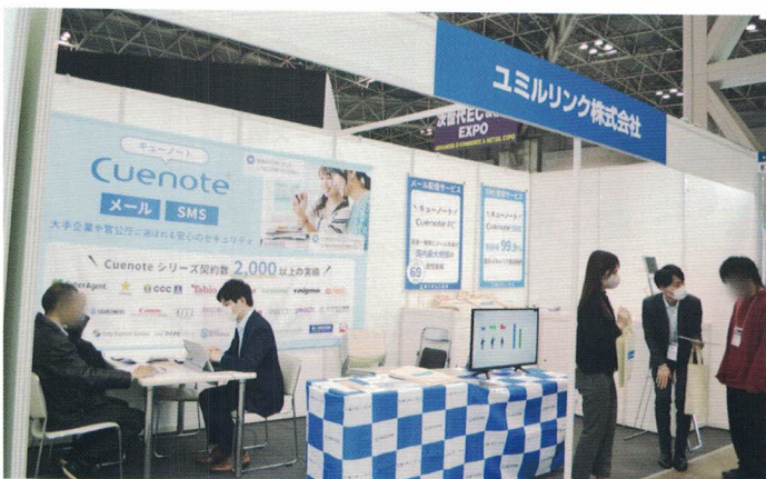
来場者とじっくりとお話しされていました

また、EC だけではなく多種多様な業種・業界の方が参加されており、多くの方に関心を持っていただけました。