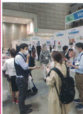
ファベックス 2023 他7展と合同開催で 53,015 名が来場

今ならオンライン社員研修無料の会員特典もあります。 info@jhba.jp 一般会員係までご連絡ください。