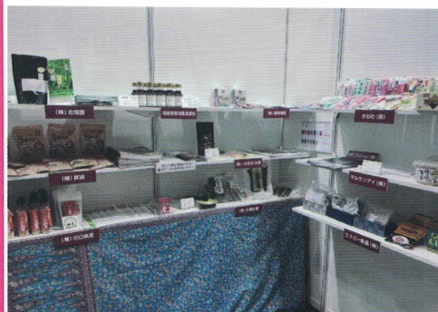
メイドインジャパンの ハラール認証商品限定