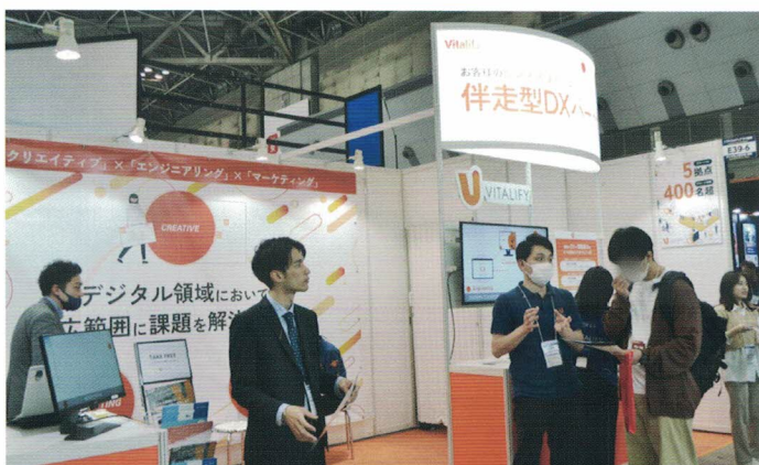
伴走型としてパートナーシップを 訴求されていました

昨今はどの業種業界においても DX は切っても切り離せないものになってきています。Japan IT Week には、毎年春秋と出展していますが、今回も多くの方が来場されている中、たくさんの方に興味を持っていただけました。