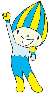
「清流の国ぎふ」 マスコットキャラクター ミナモ