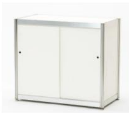
DS-947d / 展示台(引戸・W990xD495xH750)