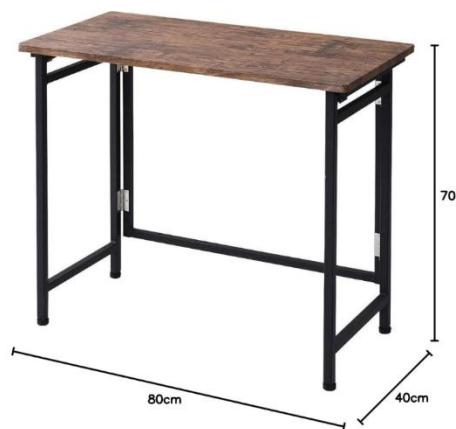
展示台イメージ (予定)